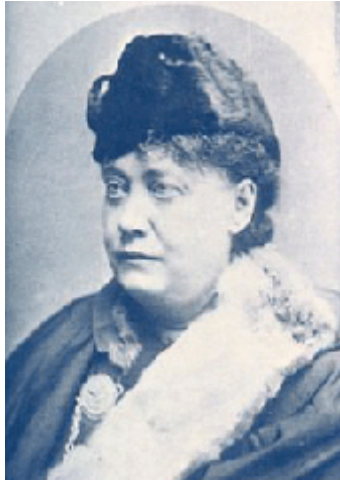
H .. P.. Blavatsky ..